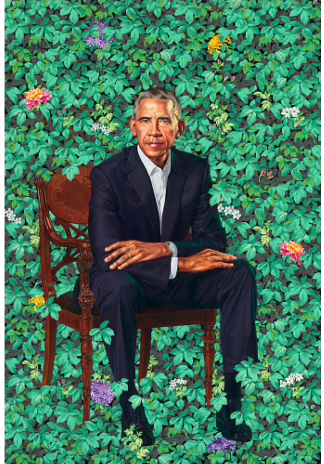
Barack Obama Kehinde Wiley 2018 Oil on canvas

National Portrait Gallery, Smithsonian Institution; acquisition made possible through the Smithsonian Latino Initiatives Pool, administered by the National Museum of the American Latino.