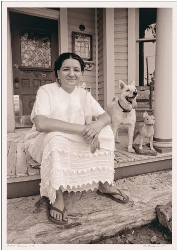
Sandra Cisneros 1998 (intd 2014) 1999 Inkjet print

National Portrait Gallery, Smithsonian Institution; acquisition made possible through the Smithsonian Latino Initiatives Pool, administered by the National Museum of the American Latino.